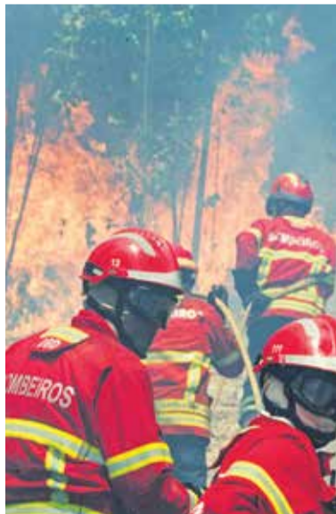
Gasilci v boju z velikim gozdnim požarom v Figueiru dos Vinhos

Smrtonosni požar do sinoči še ni bil neukročen. Kako hitro ga bo mogoče omejiti in nato pogasiti, bo odvisno od temperatur, še bolj pa od vetra. Portugalska je namreč na udaru močnega vročinskega vala. V soboto so temperature v več regijah presegle 40 stopinj Celzija. Po vsej državi je ponoči izbruhnilo kakih 60 gozdnih požarov, na terenu je bilo okoli 1700 gasilcev. (sta)